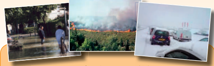
Une réponse pour faire face à ces multiples situations, LE PLAN COMMUNAL DE SAUVEGARDE :